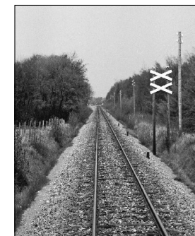
Indkørsel til Fårvang fra syd i 1971.