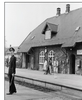
Thorsø station, 1971.

Welcome to Gjernbanen - a 53 kilometers long path for cyclists, hikers and horseriders going through the scenic landscapes of Central Jutland. The path follows the old railway from Randers to Silkeborg that transported goods and people during the peak of industrialism. From Silkeborg you can continue to Horsens or Brande, likewise on former railway tracks.