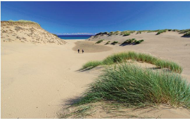
De røde sandmiler øst for Indien.