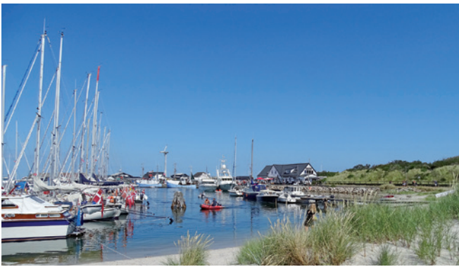
Sommer- og sejlerstemning på Anholt Havn.

I Wilhelminelyst og i de fugtige engområder vest for byen ses fiskehejre og gæs. Man kan høre natravn og nattergal. På havnen ses søkonge og der er ynglende tejt. Fra Sønderbjerg og Nordbjerg er det forår og efterår muligt at se store flokke af trækkende fugle.