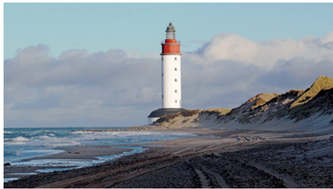
Anholt Fyr – opført 1785-1788 og forhøjet 1881.

I dag er Anholt det eneste sted i Danmark, hvor sælerne let kan observeres fra land.