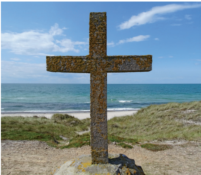
Cementkorset ved Vesterstrand.

og kontanter til øen gennem bjergninger, og flere spændende beretninger foreligger om dramatiske redningsaktioner.