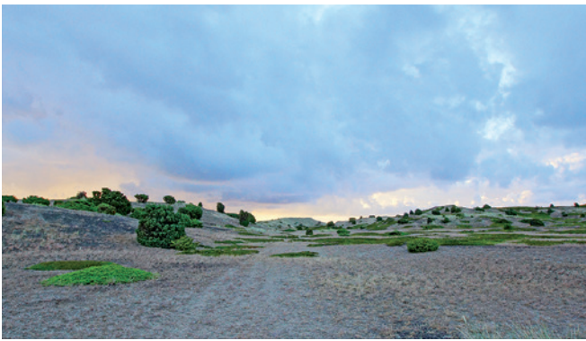
Ørkenen – så langt øjet rækker.

Redningsmandskabet har i årenes løb skaffet mange naturalier