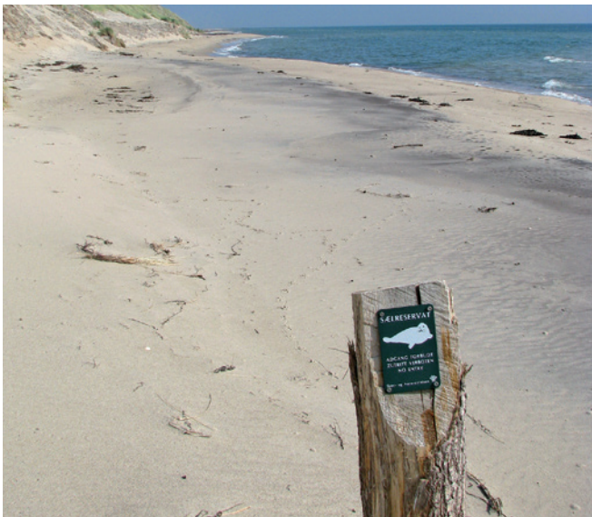
Hertil og ikke længere – sælreservatet er markeret.

Ørkenen er et unikt sted i den danske natur og blandt de skønneste naturattraktioner i Danmark. Realdania, Dansk Kyst- og Naturturisme, Naturstyrelsen og VisitDenmark har udvalgt Ørkenen som én af 50 Smuttur i Danmark i en national inspirationsguide til opdagelser i nærheden – www.smutturen.dk Ørkenen er dannet af materialer fra morænerne mod vest, ført med vind og strøm og aflejret på læsiden, samtidig med at stenalderhavet har trukket sig tilbage. Landskabet er således gammel havbund med strandvoldte og større og mindre indlandsklitter.