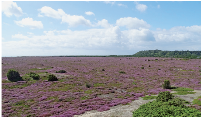
Lyngtæppe med Sønderbjerg i baggrunden.

Der er også store muligheder hvis man vil fiske. På kysten rundt om Sønderbjerg, på nordsiden af havnen og midt på Nordstrand er der gode fiskevande. Vær opmærksom på ved lystfiskeri, at der ikke findes backup på øen og vejret ændrer sig hurtigt. Fra først i maj til midt i juni er hornfiskene tæt inde under land. Derudover er der store muligheder for fangst af havørred, skrubber, ising, ål, fjæsing og endda pighvar. Der er stigende interesse for harpunfiskeri efter fladfish.