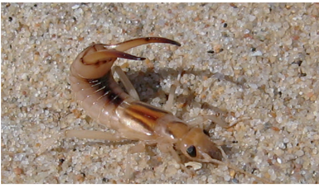
Sandørentvisten ( Labidura riparia ) – et af de sjældne insekter på Anholt.

Englændermonumentet i Anholt by er rejst 1905 til ære for de danske som faldt under kampen mod englænderne i slaget på Anholt 1811 under Napoleonskrigene.