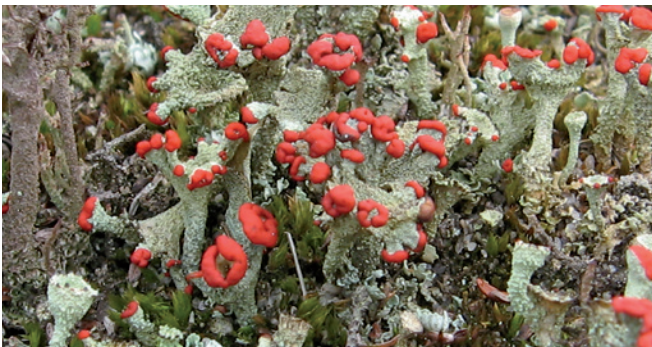
Skarlagentrød bægerlav ( Cladonia pleurota ) én af de mange laver i Ørkenen.

Der er mulighed for at plukke bær fra ene, revling, mosebølle, tranebær og en kvist af porsen til kryddersnapsen. Andre