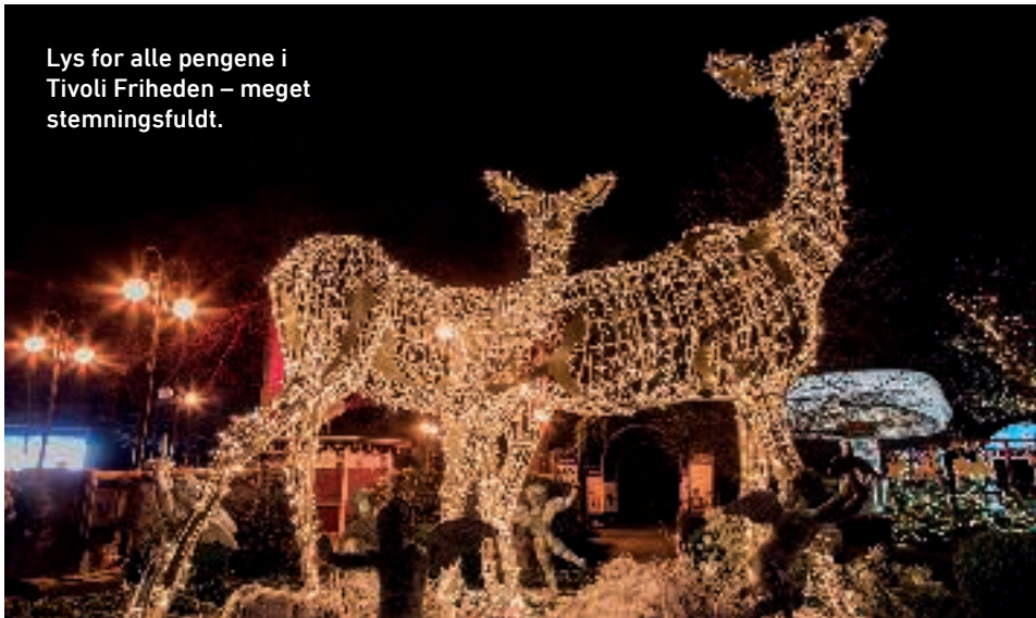
Lys for alle pengene i Tivoli Friheden – meget stemningsfuldt.

Kähler Spisesalon i Bruunsgade (ja, det er dem med vaserne) byder på smukt interiør, hygge og smørrebrød med et lille twist, spisesalon.dk