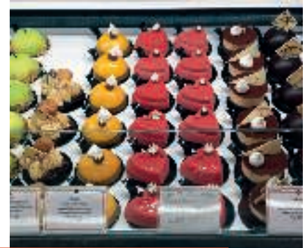
En hapser til den søde tand hos Aarhus Central Foodmarket.

Med en kop varm julekakao i maven fra caféen Hotel Chokolat i Bruuns Galleri er der lige kræfter til at besøge Aarhus Street Food i en gammel busgarage ved Rutebilstationen. Den kan minde en del om Københavns hedengangne Papiro – her er de skønneste madboder, fra indisk og thai over fish & chips og pulled duck til Mormors Køkken med tarteletter og en bod med "byens bedste flæskestegssandwich". Sidstnævnte skal smages; det er trods alt juletid. Udenfor på området sætter arrangørerne blus under en kæmpe æbleskivepande, der kan rumme 93 af slagsen. Jeg er virkelig kommet hjem til jul i Aarhus. ■