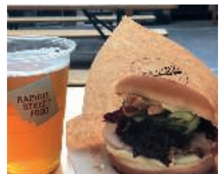
Det er jo jul, så selvfølgelig skal man smage en flæskestegssandwich på Aarhus Street Food ved Rutebilstationen.