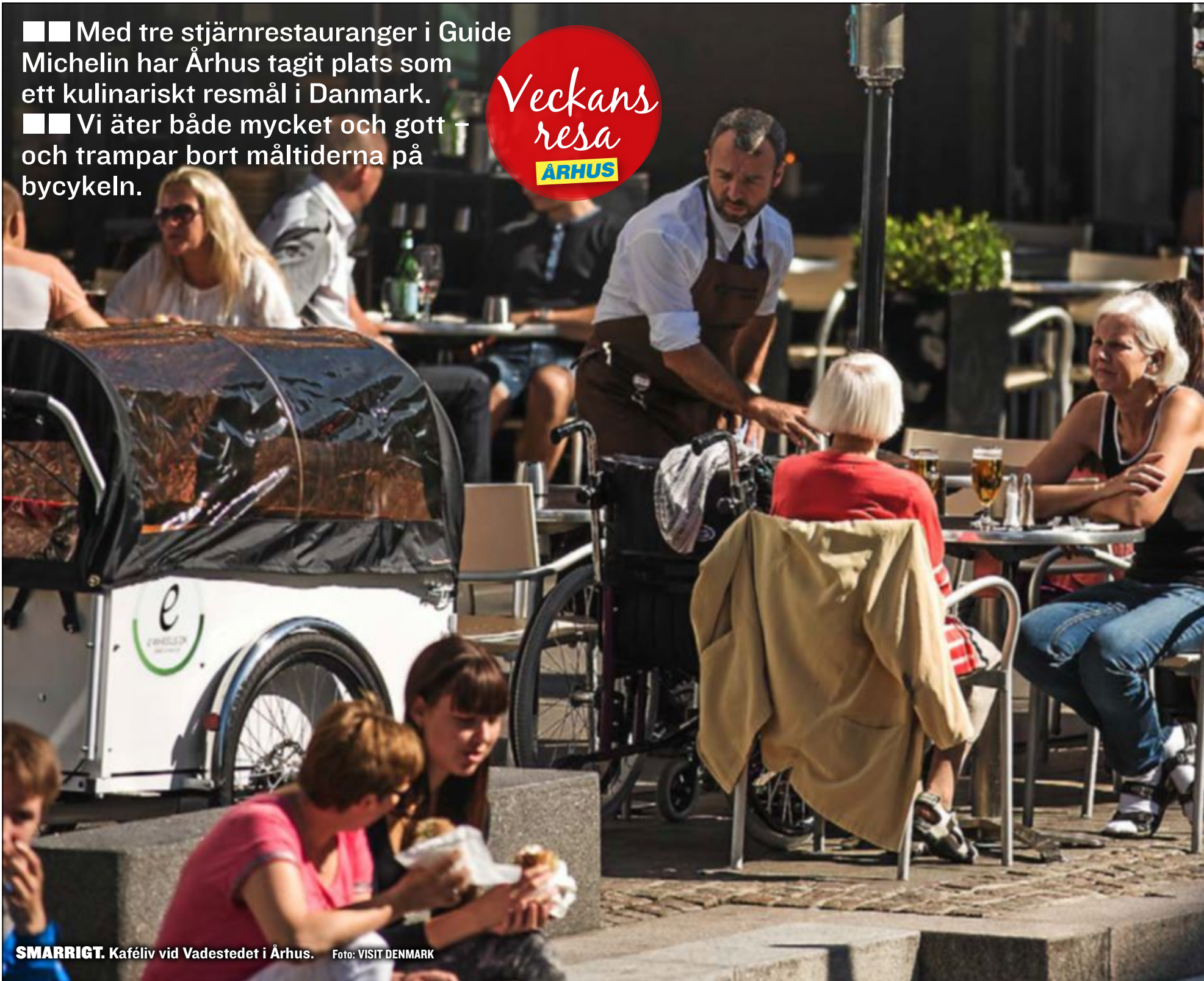
SMARRIGT. Kaféliv vid Vadestedet i Århus.