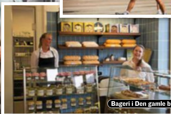
Bageri i Den gamle by.