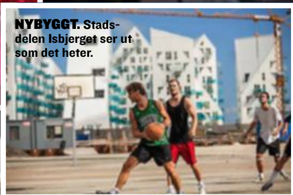
NYBYGGT. Stadsdelen Isbjerget ser ut som det heter.