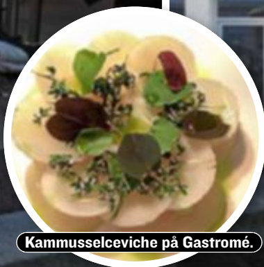
Kamusselcevicehe på Gastromé.