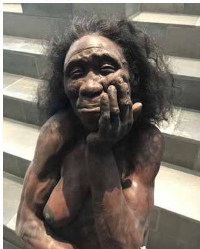
Hun her møte vi sittende i trappa, riktig nok på Moesgaard Museum, Aarhus' nye stolthet. Det er sjelden vi stortrives på museum, men her har de klart å skape noe helt nytt som fenger.