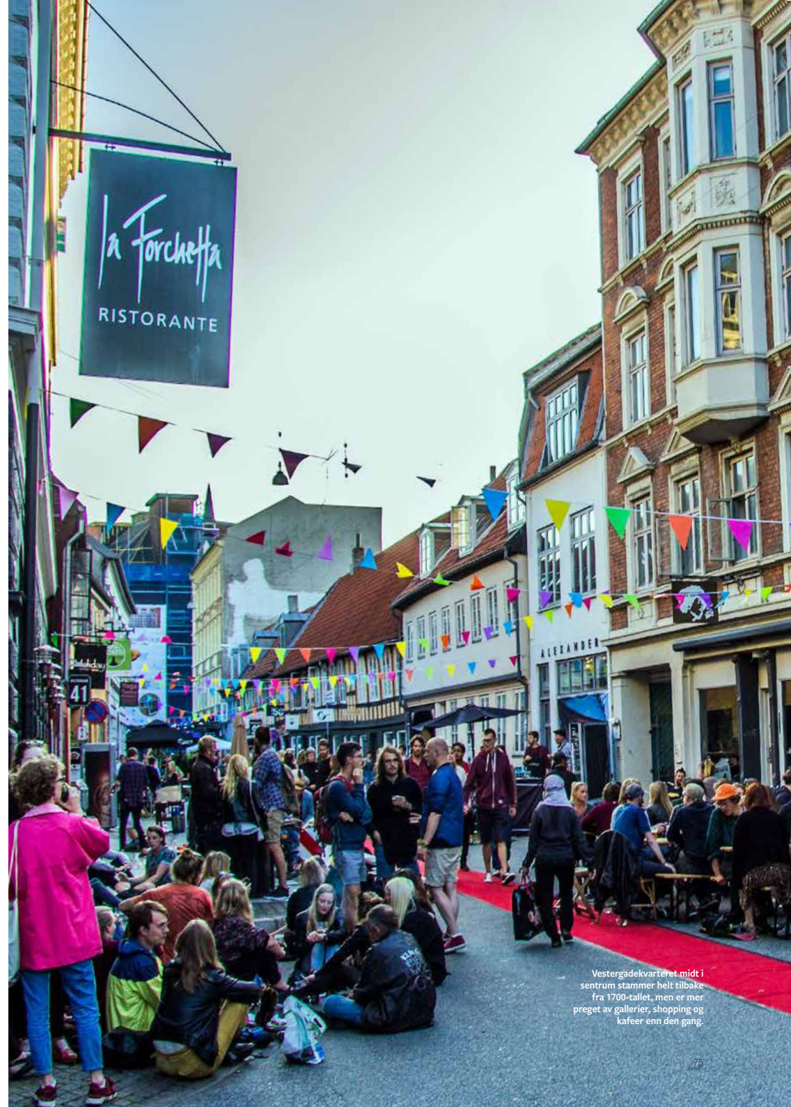
Vestergadekvarteret midt i sentrum stammer helt tilbake fra 1700-tallet, men er mer preget av gallerier, shopping og kafeer enn den gang.